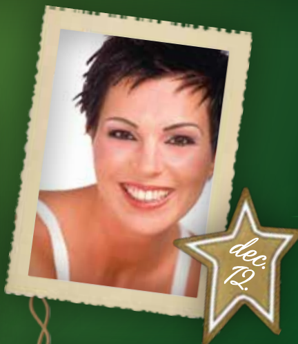
Auth Csilla koncert