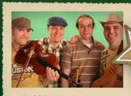
Alma Együttes gyermekműsora