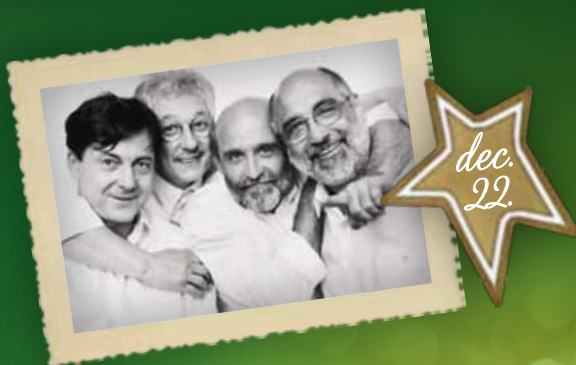
Kalácsa együttes koncert