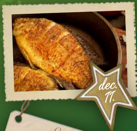
Szigetközi halkülönlegességek napja