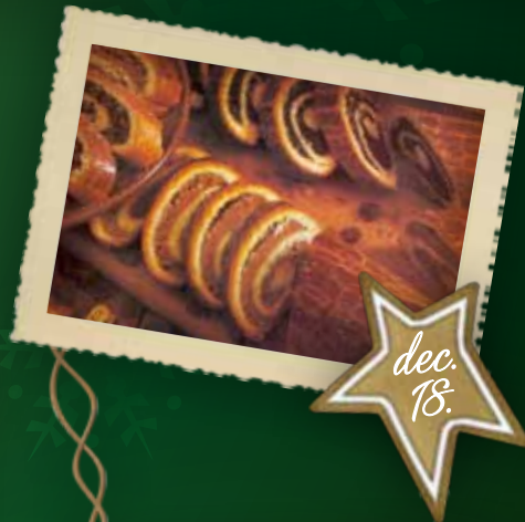
Ünnepi beigli sütés